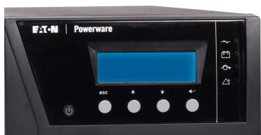
ЖК-дисплей с поддержкой русского языка