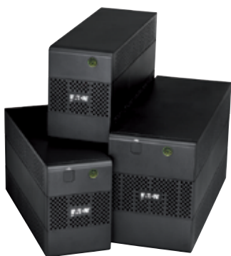
ИБП серии 5E