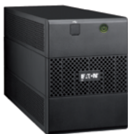
ИБП 5E 1100 USB